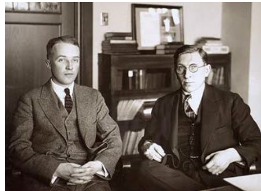
Frederick Grant Banting und Charles Herbert Best